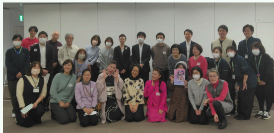
たくさんの方のご参加、ありがとうございました。