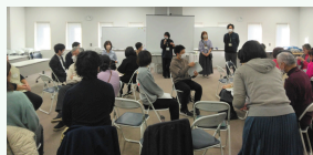
プロジェクト報告の様子

●協力：あーすりんく、みんなの世界テーブル、あまいろソーシャルオフィス、はらじゅくファンイン、フリースクールまいまい「いるか家」、代々木高校、民生児童委員